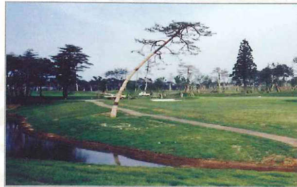
1985年 名物の一本松も、