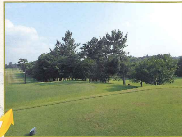
見えなくなりました、 2015年