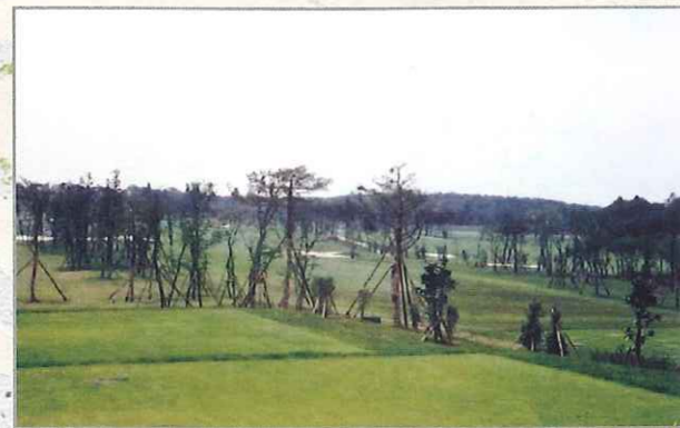
1985年 となりのホールが、