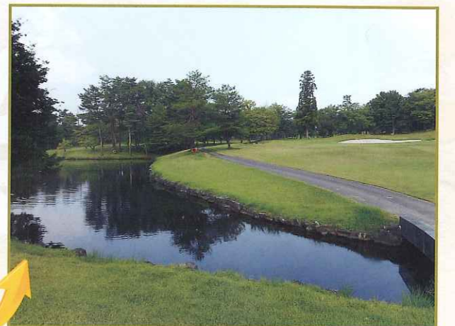
台風で倒れて しまいました。 2015年