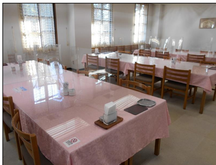
コンペールーム感染対策(利用時は窓を開け換気)