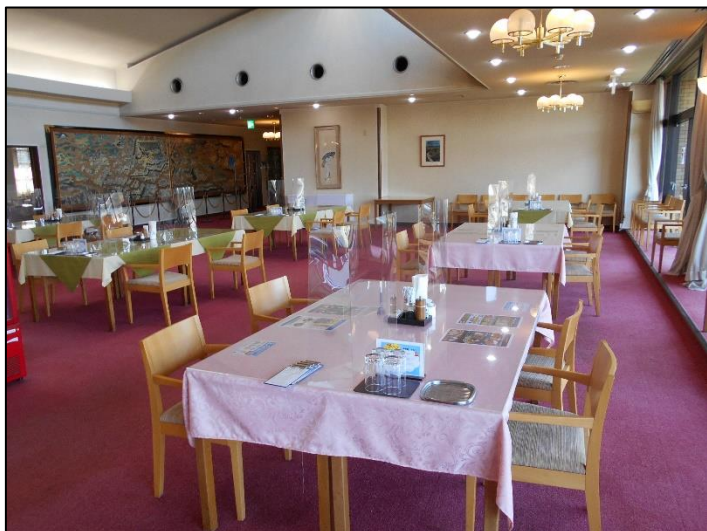
新型コロナウイルス感染対策