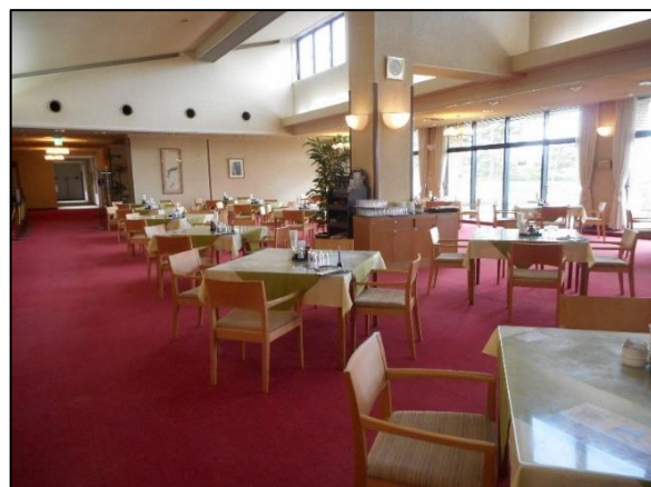
新型コロナウイルス感染対策 前