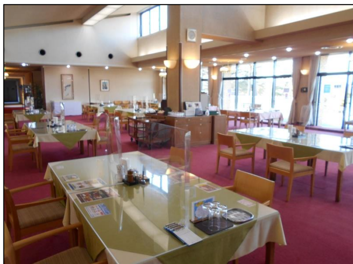
新型コロナウイルス感染対策