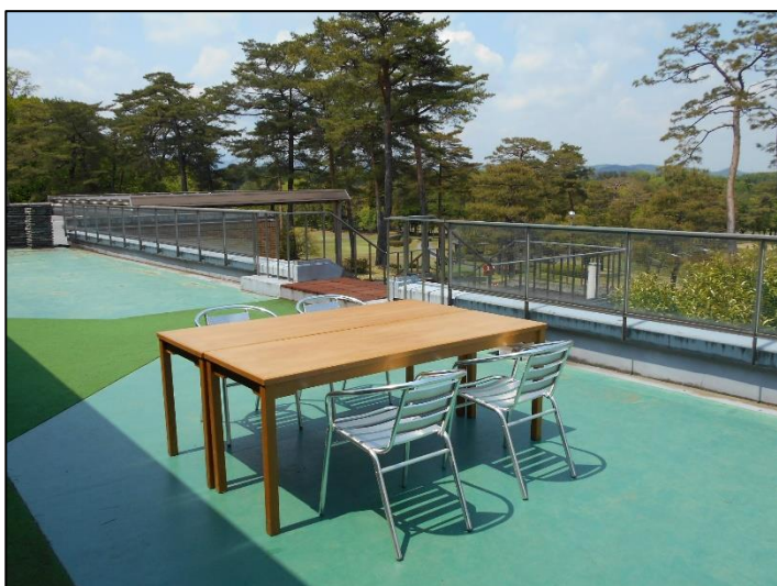
テラス席もご用意しております。